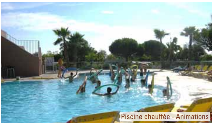
Piscine chauffée - Animations