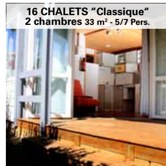
16 CHALETS "Classique" 2 chambres 33 m 2 - 5/7 Pers.

Ausgestattete Küche, Mikrowelle, Kochplatte, Kühlschrank mit Gefrierfach, Kaffeemaschine, Geschir, 1 Doppelbettcouch. Bad und WC getrennt. 2 Zimmer : 1 Bett 190x140 & 2 Betten 190x70.