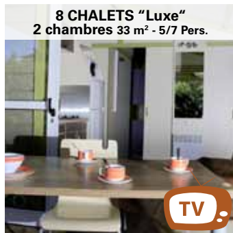
8 CHALETS "Luxe" 2 chambres 33 m 2 - 5/7 Pers.

Ausgestattete Küche, Mikrowelle, Kochplatte, Kühlschrank mit Gefrierfach, Kaffeemaschine, Geschir, 1 Doppelbettcouch. Bad und WC getrennt. 2 Zimmer : 1 Bett 190x140 & 2 Betten 190x70.