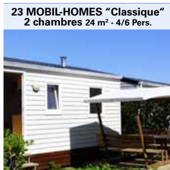
23 MOBIL-HOMES "Classique" 2 chambres 24 m 2 - 4/6 Pers.

Sans sanitaires - Without sanitary Ohne Gesundheit