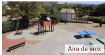
Aire de jeux