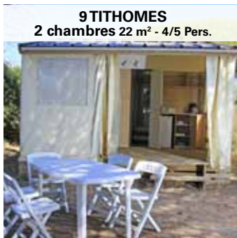
9 TITHOMES 2 chambres 22 m 2 - 4/5 Pers.