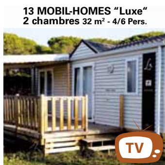
13 MOBIL-HOMES "Luxe" 2 chambres 32 m 2 - 4/6 Pers.

Ausgestattete Küche, Mikrowelle, Kochplatte, Kühlschrank mit Gefrierfach, Kaffeemaschine, Geschir, 1 Doppelbettcouch, Bad und WC getrennt. 2 Zimmer : 1 Bett 190x140 & 3 Betten 190x70.