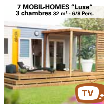
7 MOBIL-HOMES "Luxe" 3 chambres 32 m 2 - 6/8 Pers.

Wohnzimmer: 1 Tisch mit 2 Stühlen, Sofa, Speichereinheit, Fernsehen, Ausgestattete Küche, Mikrowelle, Kochplatte, Kühlschrank mit Gefrierfach, Kaffeemaschine, Geschir. Bad und WC getrennt. Zimmer 1 : 1 Bett 190x140, Zimmer 2 (und 3 für "Luxe" 3 Schlafzimmer) : 3 Betten 190x70. Außen : 1 überdachte Terrasse mit 2 Liegestühlen.