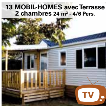
13 MOBIL-HOMES avec Terrasse 2 chambres 24 m 2 - 4/6 Pers.