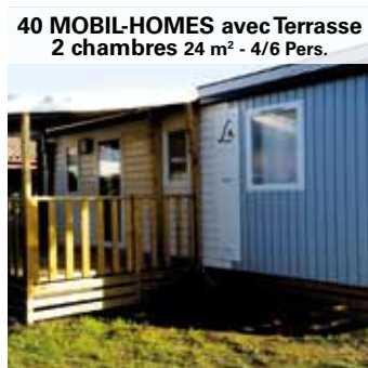
40 MOBIL-HOMES avec Terrasse 2 chambres 24 m 2 - 4/6 Pers.

Ausgestattete Küche, Mikrowelle, Kochplatte, Kühlschrank mit Gefrierfach, Kaffeemaschine, Geschir, 1 Doppelbettcouch. Bad und WC getrennt. 2 Zimmer : 1 Bett 190x140 & 2 Betten 190x70.